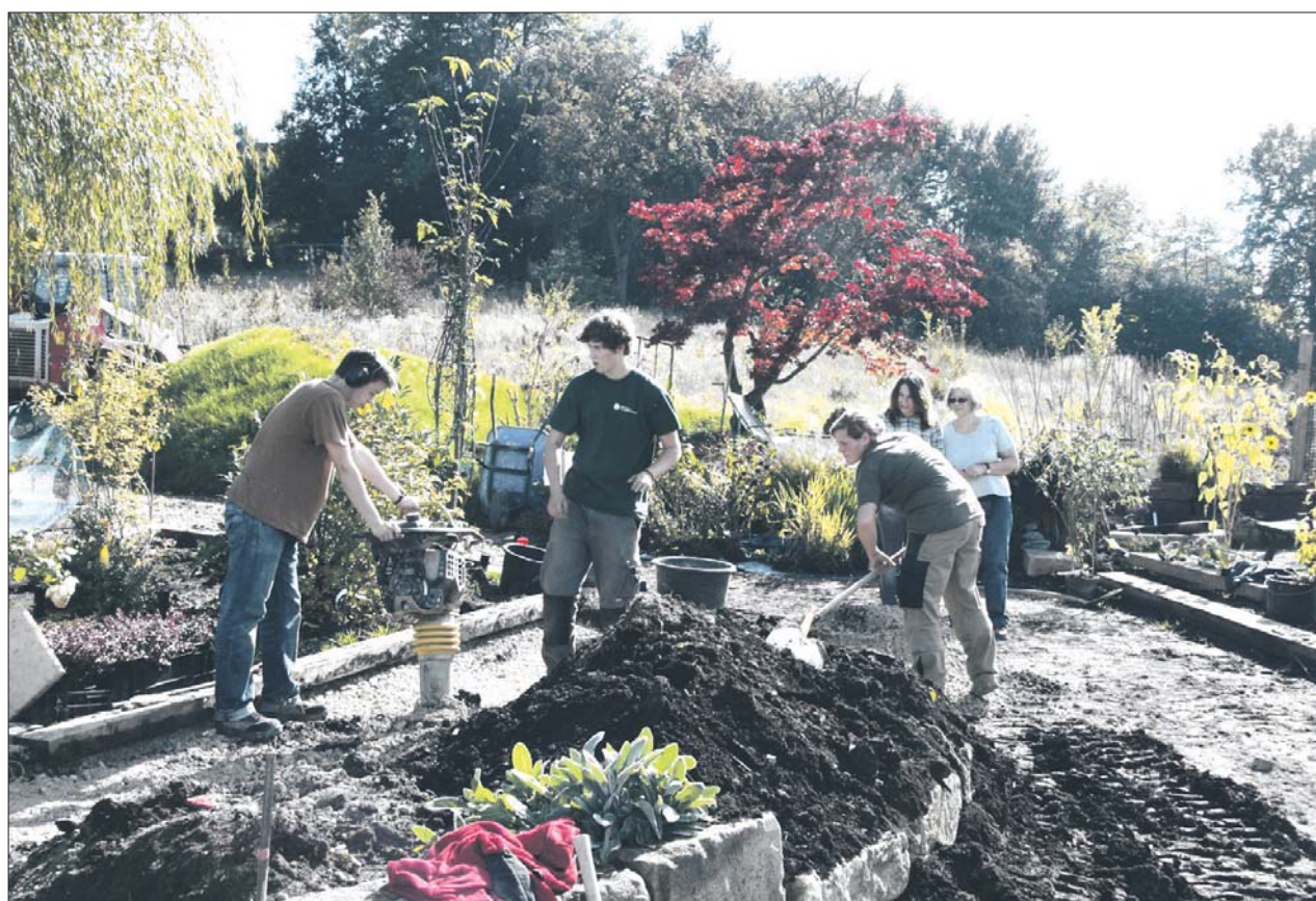
Erste Erfahrungen im Gartenbau sammeln Schüler des Nürtinger Max-Planck Gymnasiums im zweitägigen Workshop.

Jugendliche verbringen heute deutlich mehr Zeit mit schulischer und beruflicher Bildung als die Generation ihrer Eltern und Großeltern. Im Ergebnis ist der durchschnittliche Azubi in Deutschland 19,7 Jahre alt, so die Statistik des Bundesinstituts für Berufsbildung. Der Übergang in die berufliche Ausbildung ist besonders schwierig für Hauptschüler und Schulabgänger ohne Abschluss.